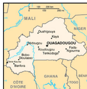
Le Burkina Faso