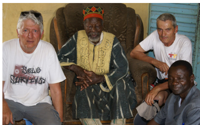
Avec le Chef du village

arrivés des champs, du village et d'autres sentiers alentours pour nous rejoindre et partager la boisson de bienvenue à base d'eau et de jeunes pousses de mil pressées. Nous avons ensuite expliqué tout ce que nous allons faire. Tout le monde a applaudi ! Comme l'école est à quelques kilomètres du village, il est prévu que nous y allons le lendemain. En attendant, nous partons visiter l'emplacement du futur maraîchage. Les anciens et le responsable des cultures nous indiquent où le forage devra être fait, car plusieurs études ont montré que l'eau était peu profonde. Le terrain ne présente pas de termitières. Nous avons donc la certitude que l'eau est tout près ! Revenus au village, le Chef nous désigne un local dans le village où sera installé le chargeur de téléphones portables. Après cette première journée, le soleil descend dans le ciel, la température devient plus supportable, il est temps de rejoindre notre hôtel.