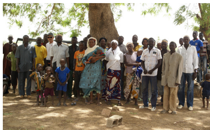
Sous l'arbre à palabre